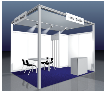
COMFORT, (Beispiel 12 m 2 )