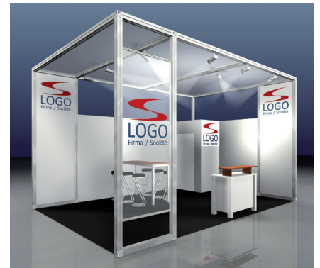
DELUXE, (Beispiel 24 m 2 )